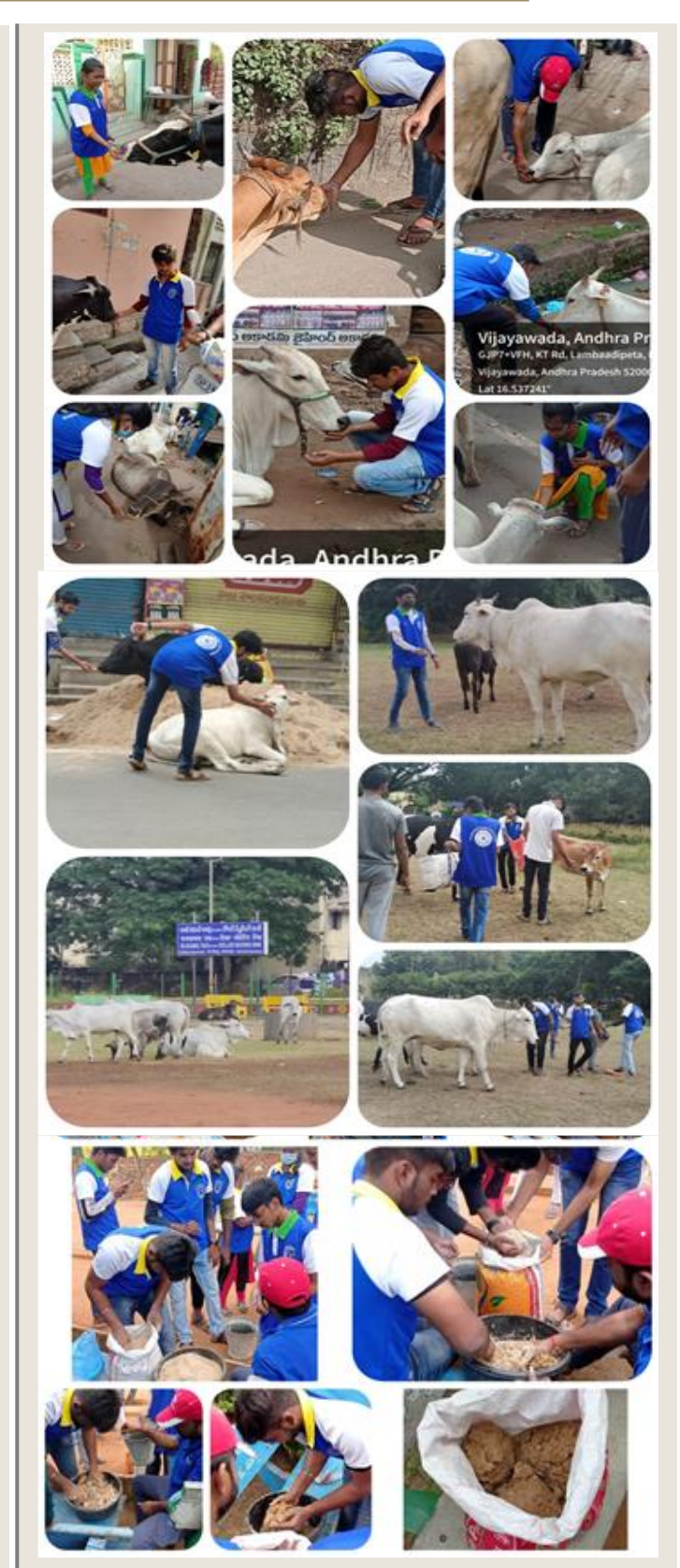
NSS Unit-I has taken a step forward with a great move i.e. feeding the cows in the streets of Satya Narayana Puram and Chitti Nagar, as those cows could not get the food daily.