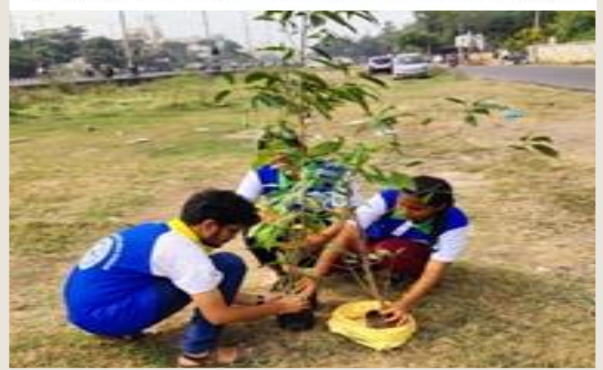
NSS unit I started another new programme called Mission – Bahuguna , it is a tree plantation programme, and in this all NSS volunteers must plant at least one tree near their area. The main theme is Save Nature Save Earth and to make the city greenery and to protect city from heavy temperature.