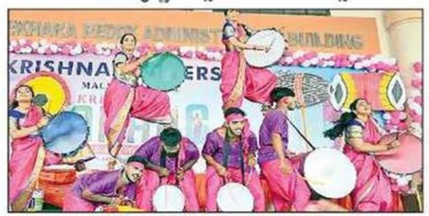
నృత్య ప్రదర్శనతో ఆకట్టుకున్న విద్యార్థులు

కృష్ణావిశ్వవిద్యాలయం (మచిలీపట్నం), స్యూస్ట్ టుడే: యువత తుhoత, కవ్వింత, కేరింతలతో కృష్ణా విశ్వవిద్యాలయం హోరెత్తింది. కృష్ణా తరంగ్ పేరిట రెండు రోజుల పాటు నిర్వహించిన యువజనోత్సవాలు శనివారం విజయవంతంగా ముగిశాయి. విశ్వవిద్యాలయంతో పాటు అనుబంధ కళాశా లల విద్యార్యలు సైరా సై అంటూ పోటీపడ్డారు. కొందరు సంస్థుదాయ, జాన పద నృత్యాలతో ఆకట్టుకుంటే.. మరికొందరు పాశ్చాత్య బాణీలకు చిందు ఇంకా వివిధ రకాల నాటికలు, గీతాలపనతో