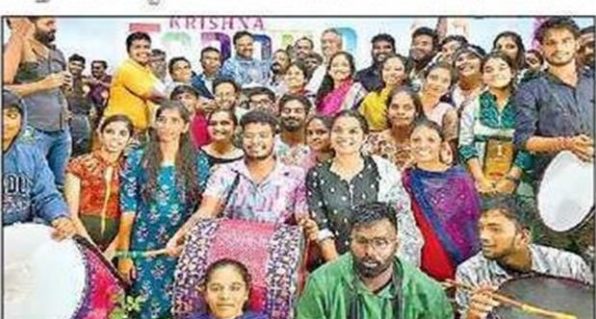
බැම්ජවණි එක් ජාවක්ව, වැළුැත්රී ජධ්ජරාවා

కృష్ణావిశ్వవిద్యాలయం (మచిలీపట్నం), స్యూస్ట్ టుడే: యువత తుhoత, కవ్వింత, కేరింతలతో కృష్ణా విశ్వవిద్యాలయం హోరెత్తింది. కృష్ణా తరంగ్ పేరిట రెండు రోజుల పాటు నిర్వహించిన యువజనోత్సవాలు శనివారం విజయవంతంగా ముగిశాయి. విశ్వవిద్యాలయంతో పాటు అనుబంధ కళాశా లల విద్యార్యలు సైరా సై అంటూ పోటీపడ్డారు. కొందరు సంస్థుదాయ, జాన పద నృత్యాలతో ఆకట్టుకుంటే.. మరికొందరు పాశ్చాత్య బాణీలకు చిందు ఇంకా వివిధ రకాల నాటికలు, గీతాలపనతో