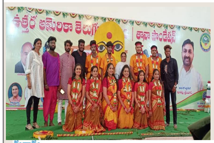
epaper eenadu net