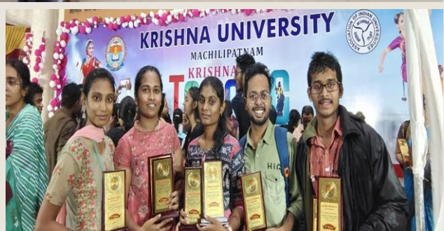
MBA students participated in Krishna University's Krishna Tarang (Youth Festival) during 9-10, December and won many prizes and contributed to College bagging Overall Championship.